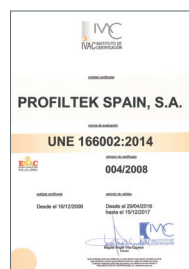
UNE 166002:2014 Gestión de I+D+i